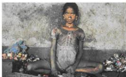
Recyclage de piles à Calcutta (Inde)

L'avenir de notre planète se joue en ce moment, et le traitement des déchets à une place importante dans cet avenir. C'est pourquoi nous proposons que l'état finance à la hauteur des enjeux le développement de la recherche pour le traitement et le recyclage de tous les déchets, que ce soit issus de la production humaine ou industrielle.