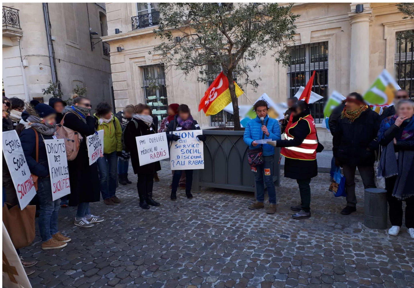
Journée d'action nationale le 22 mars 2018 devant l'Hôtel du département Mobilisation contre la réorganisation du Pôle Solidarités

POUR NE PLUS SUBIR – PASSONS A L'OFFENSIVE PAS DE LUTTE GAGNANTE SANS MOBILISATION COLLECTIVE VOTONS ...VOTONS CGT!