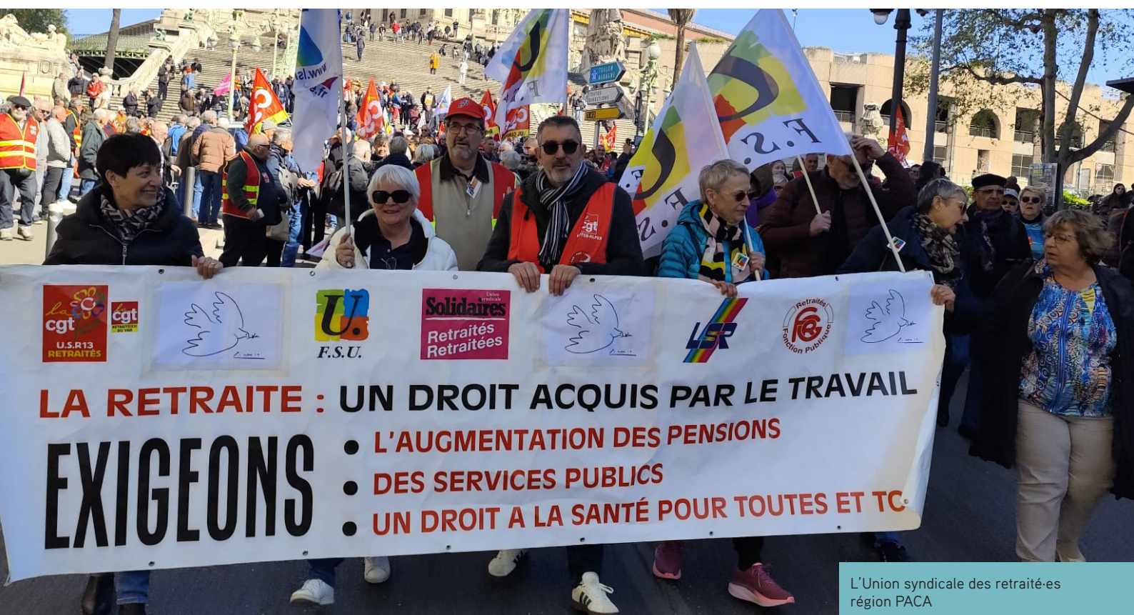
L'Union syndicale des retraité-es région PACA

Le 2 avril 2026, à l'appel de l'UCR, plusieurs dizaines de milliers de retraité-es se sont mobilisé-es dans près de 120 rassemblements ou manifestations sur l'ensemble du territoire. Elles et ils ont été dans beaucoup d'endroits rejoint-es par des salarié-es.