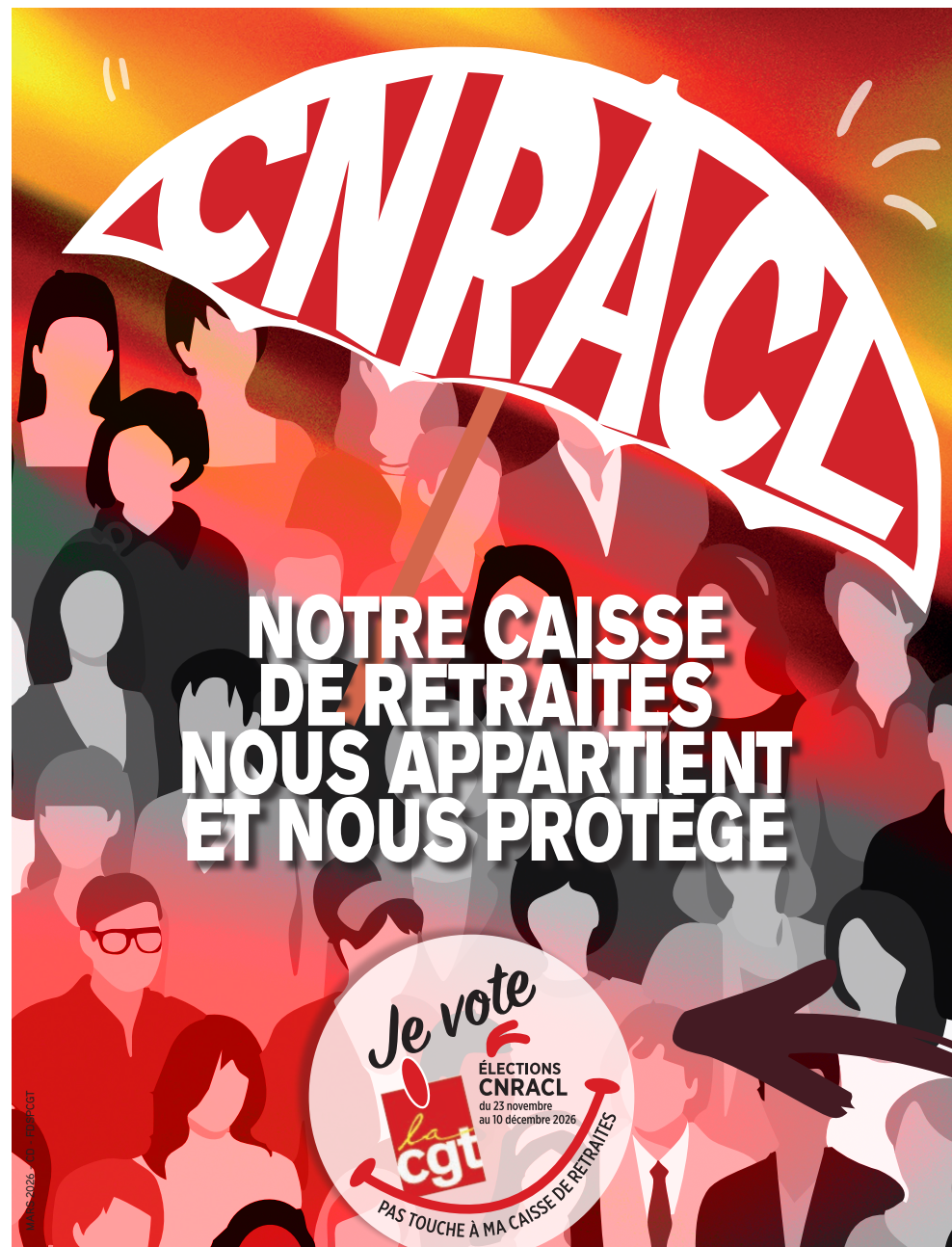
CNRACL : Caisse nationale de retraites des agents des collectivités territoriales